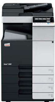
ineo+ 368 con alimentador dual scan (DF-704), bandeja de salida (OT-506) y mesa cassette (PC-210)

Invierta en una ineo+ 368 y se olvidará de depender de empresas externas para trabajos especializados como invitaciones impresas en papel grueso y de alta calidad. Esto le ahorrará tiempo y dinero. La ineo+ 368 admite sobres, papel reciclado, papel preimpreso, transparencias, y muchos otros formatos, incluso tarjetas de hasta 300 g/m 2 . Este sistema puede imprimir una amplia gama de formatos de papel desde A6 hasta SRA3 o formatos especiales definidos por el usuario y banners de hasta 1.2 metros de longitud. Las numerosas opciones de acabado permiten la creación de folletos de hasta 80 páginas, documentos con varios acabados como grapados o perforados. La ineo+ 368 puede realizar casi cualquier tipo de acabado.