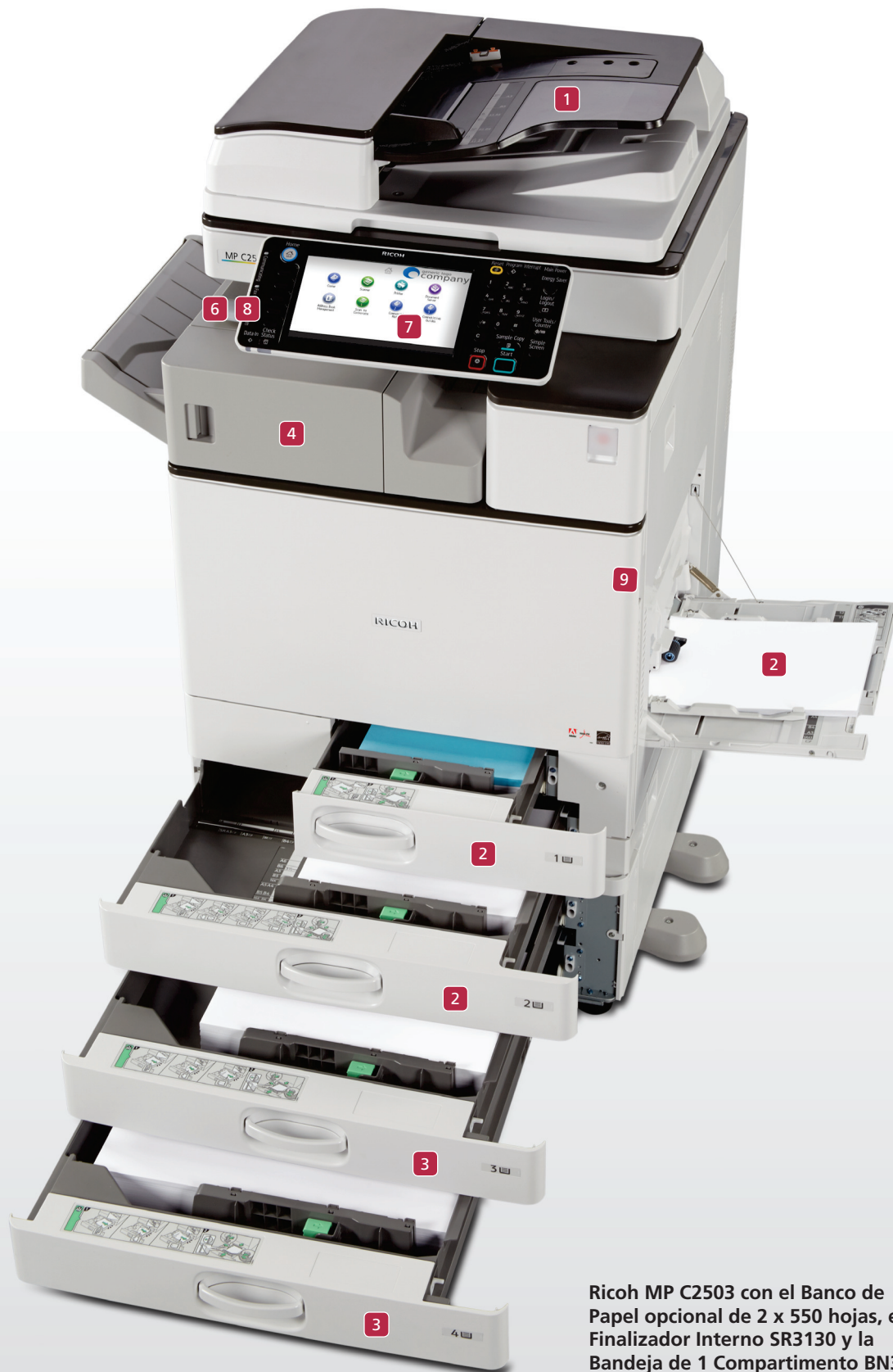
Ricoh MP C2503 con el Banco de Papel opcional de 2 x 550 hojas, el Finalizador Interno SR3130 y la Bandeja de 1 Compartimento BN3110