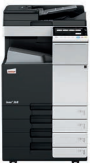
ineo+ 368 con alimentador dual scan (DF-704), bandeja de salida (OT-506) y mesa cassette (PC-210)

Invierta en una ineo+ 368 y se olvidará de depender de empresas externas para trabajos especializados como invitaciones impresas en papel grueso y de alta calidad. Esto le ahorrará tiempo y dinero. La ineo+ 368 admite sobres, papel reciclado, papel preimpreso, transparencias, y muchos otros formatos, incluso tarjetas de hasta 300 g/m 2 . Este sistema puede imprimir una amplia gama de formatos de papel desde A6 hasta SRA3 o formatos especiales definidos por el usuario y banners de hasta 1.2 metros de longitud. Las numerosas opciones de acabado permiten la creación de folletos de hasta 80 páginas, documentos con varios acabados como grapados o perforados. La ineo+ 368 puede realizar casi cualquier tipo de acabado.