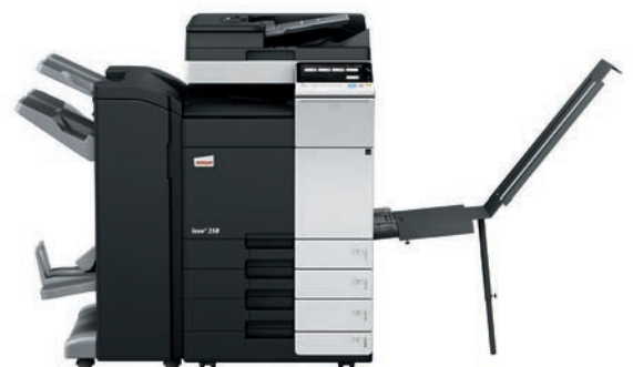
ineo+ 258 con alimentador dual scan (DF-704), finalizador grapador/plegador (FS-534SD), bandeja banner (BT-C1e) y mesa cassette (PC-210)