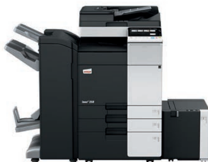
ineo+ 258 con alimentador dual scan (DF-704), finalizador grapador/plegador (FS-534SD), cassette gran capacidad (LU-302) y mesa cassette (PC-410)