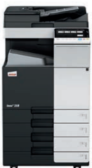
ineo+ 258 con alimentador dual scan (DF-704), bandeja de salida (OT-506) y mesa cassette (PC-210)

Invierta en una ineo+ 258 y se olvidará de depender de empresas externas para trabajos especializados como invitaciones impresas en papel grueso y de alta calidad. Esto le ahorrará tiempo y dinero. La ineo+ 258 admite sobres, papel reciclado, papel preimpreso, transparencias, y muchos otros formatos, incluso tarjetas de hasta 300 g/m 2 . Este sistema puede imprimir una amplia gama de formatos de papel desde A6 hasta SRA3 o formatos especiales definidos por el usuario y banners de hasta 1.2 metros de longitud. Las numerosas opciones de acabado permiten la creación de folletos de hasta 80 páginas, documentos con varios acabados como grapados o perforados. La ineo+ 258 puede realizar casi cualquier tipo de acabado.